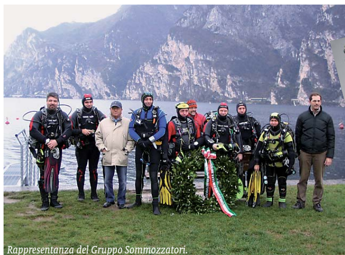
Rappresentanza del Gruppo Sommozzatori.